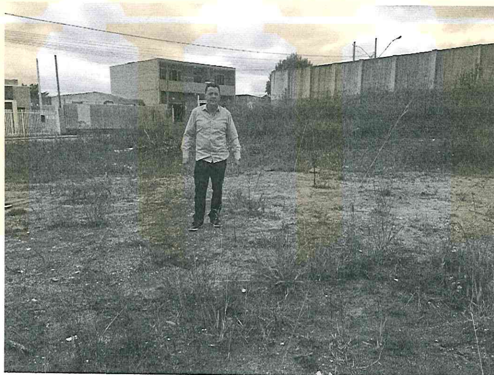
(Terreno vago localizado ao lado da instituição)